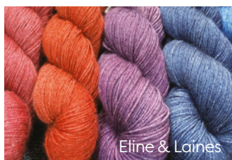
Eline & Laines