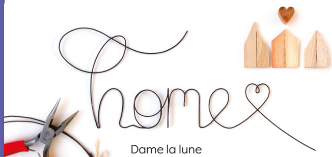
Dame la lune

Inscription aux ateliers et planning : https://www.creations-savoir-faire.com/Animations-et-ateliers/Inscrivez-vous-aux-ateliers